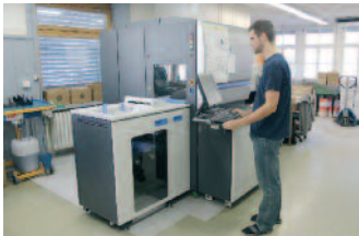
HP Indigo in Schiers: nebst Standardfarben auch Pantone, Weiss und Mattlack-Effekte.

Im vergangenen September hat der digitale Offsetdruck auch im Prättigau Einzug gehalten. Die Buchdruckerei Schiers, die zur Druckerei Landquart gehört, hat ihre bestehende Offsetmaschine durch eine HP Indigo ersetzt. Was sich in vielen Druckereien abspielt, ist auch bei den Schwarzkünstlern am Fusse des Landquartbergs ein Dauerthema: sinkende Auflagen und kürzere Produktionszeiten – und das selbstver-